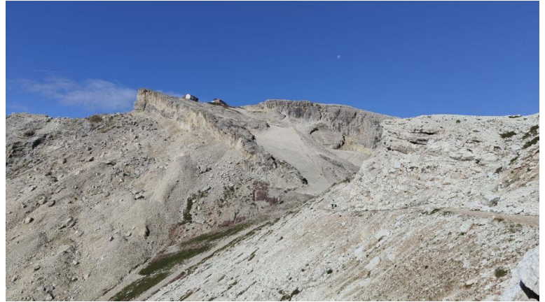
Rifugio Lagazuoi visto dalla Forcella Travenanzes