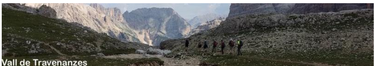
Vall de Travenanzes

La Val Travenanzes è una delle escursioni più belle da fare intorno a Cortina: offre una varietà faunistica e botanica eccezionale, e anche qualche spunto di meditazione sulla Grande Guerra che fu combattuta in questi luoghi tra il 1915 e il 1917.