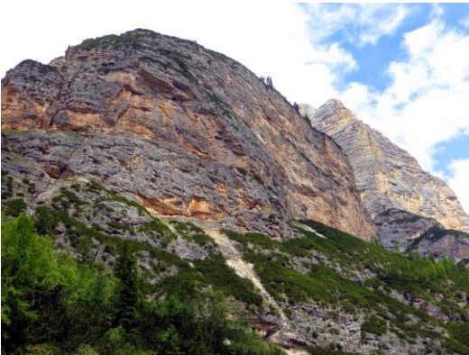
Panorama lungo la val Travenanzes