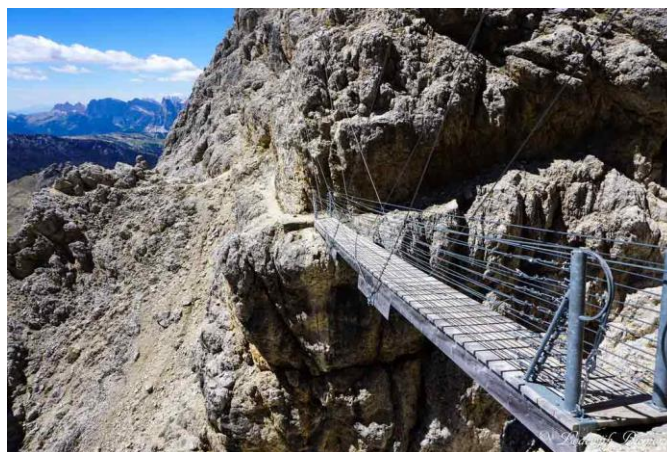
Ponte lungo il percorso Kaiserjager

Arrivati al rifugio Lagazuoi prendiamo la funivia (costo:15 euro) per tornare al passo Falsarego dove ci aspetta il pulman per condurci al rifugio Valparola .